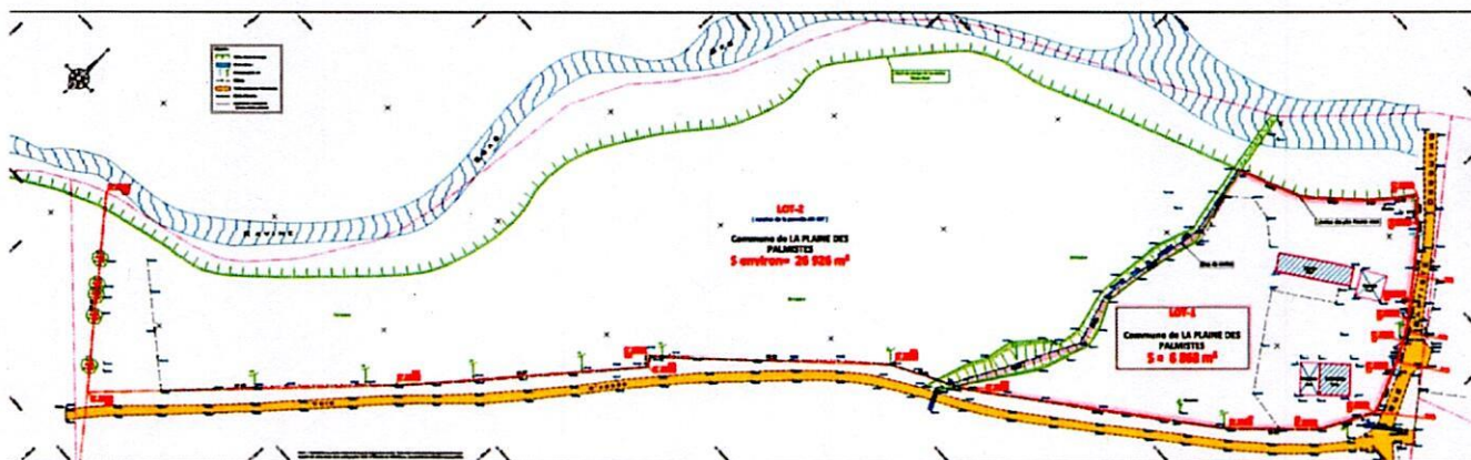
Plan de division AX 107

Par courrier en date du 16 mars 2022, Madame PERSEE ISOP Germaine a manifesté à la commune son intérêt d'acquérir la parcelle communale cadastrée AX 107 (p) située rue Baptiste Dégoutho, d'une superficie de 26 926 m 2 .